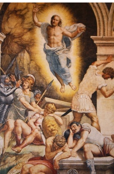
Il Cristo Risorto della nostra Cattedrale di Cremona

I consigli, a riguardo, si sono sprecati: «Cogli l'attimo fuggente ... Godi finché sei in tempo, prima che il tuo corpo ti tradisca ... ». Ma abbiamo dovuto constatare che l'attimo è più smalzato di quanto si potesse credere e prima di essere afferrato è già svanito. Pensare di godere l'attimo è