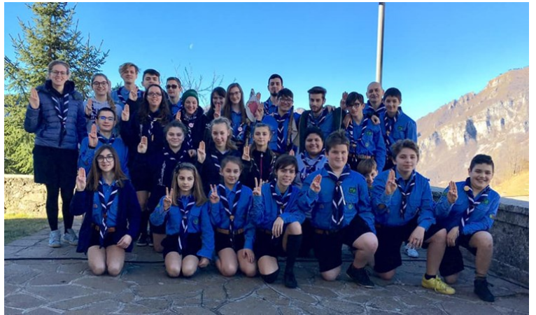
Foto di gruppo prima del rientro dal Campo invernale

Ora, come sempre nella seconda parte dell'anno, ci aspettano i vari impegni zonali: Festa di Primavera per i Lupetti e campo San Giorgio per i ragazzi e le ragazze del Reparto, entrambe occasio-