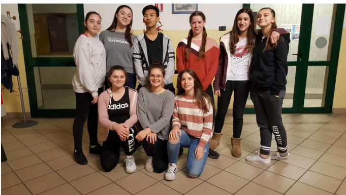
Il nostro corpo di ballo durante le prove